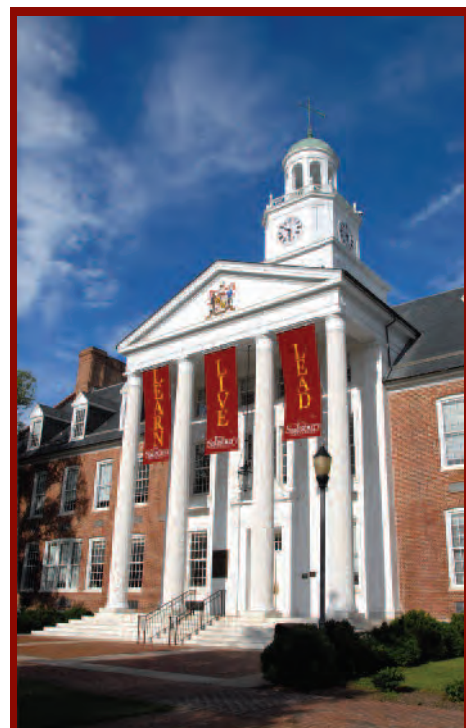
Salisbury University Salisbury, Maryland, USA

索尔兹伯里大学提供42个本科专业和14个研究生专业。学科涉及文科，理科和技术，商科，教育和专业研究。如果考虑学习辅修专业，将会有超过100个机会为你构建理想方案。如果你选择了杰出的危机分析和冲突消解专业，专注于社会工作专业，专注于公认的商业贸易，挑战职前专业培训等专业，将会你将来进入法学院，医学院或教学生涯等打下良好基础。